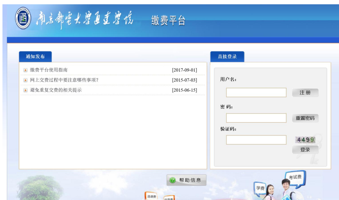
图 1-1 系统登陆界面

1、登录：打开 IE，输入网址 cwpay.nytdc.edu.cn ，即可进入支付平台登录页面， 学生登陆的用户名和密码均为学号 。系统登陆界面如下图所示。（如验证码不显示请刷新页面）